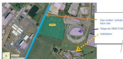
Figure 4 : Parcelle et aménagement à prévoir